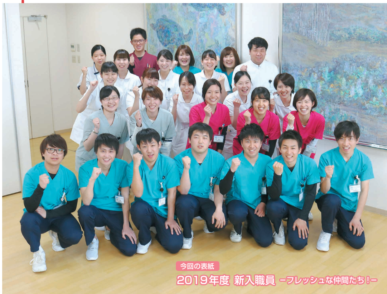
今回の表紙 2019年度 新入職員 -フレッシュな仲間たち!-